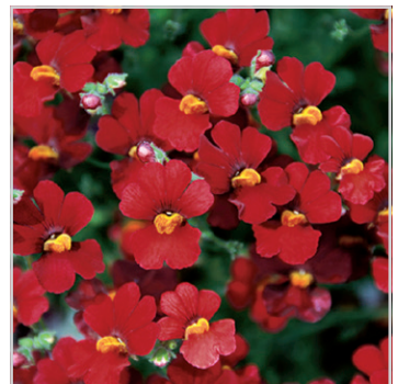
Sunsatia™ plus 'Granada'

Nesia™ Banana Swirl, zweifarbig, rosa mit gelber Lippe