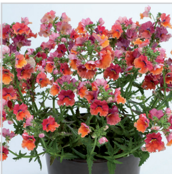
Nemesia Nesia Tropical