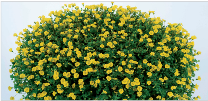
Mecardonia Garden Freckles

Eine der besten Nemesien-Serien mit kompaktem, kugeligem Aufbau. Sehr schöne Farbpalette mit zahlreichen nach Honig duftenden Blüten, die frühzeitig erscheinen.