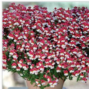
Sunsatia™ plus 'Cherry on Ice'