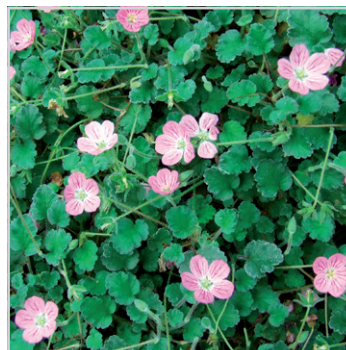
Erodium Bishop's Form